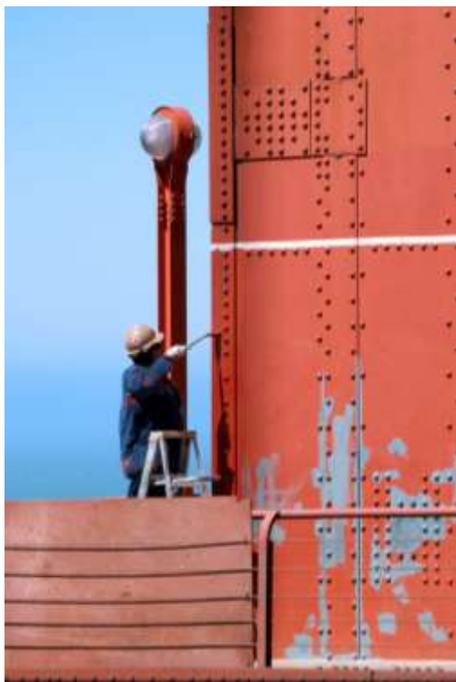
Un coup de peinture pour le Golden Gate Bridge

Observation: Dans une première phase, les activités de planification de la pérennisation seront enclenchées par des impulsions externes. Celles-ci pourront provenir non seulement de l'observation de blogs, de forums ou de plateformes spécialisées telles que FFRR (OPF File Format Risk Registry), mais également de messages et de renseignements issus des Archives. Nous prions donc les membres du CECO et les autres utilisateurs du Catalogue des formats de fichiers d'archivage de bien vouloir communiquer au Bureau tout problème avec des formats du Cfa ( info@kost.ceco.ch ) afin que nous puissions analyser le fichier ou le format.