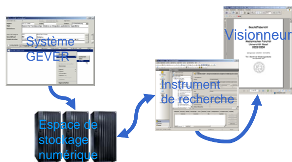
Du système productif aux archives

La deuxième phase du projet a permis d'affiner la modélisation des données et de spécifier les interfaces des systèmes. Les Archives qui ont participé à ce projet ont élaboré, sur cette base, trois prototypes différents. Les Archives d'État de Saint-Gall ont testé, dans le cadre d'un projet pilote, la solution logicielle DIAS d'IBM. Les Archives d'État de Zoug ont élaboré leur propre prototype dans un environnement J2EE. Le CECO, enfin, a réalisé un prototype d'interface en XML et en XSL/T, qui doit servir d'implémentation de référence pour la modélisation AUGev. La documentation réunie dans le cadre de ces trois prototypes décrit les structures de données SIP et AIP ; elle est résumée dans le document " Résumé : modélisation des données et interfaces des systèmes ".