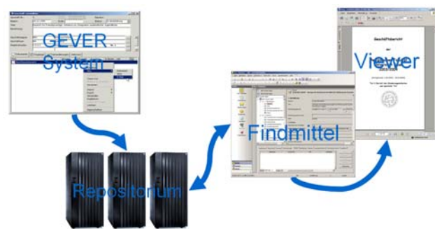
Vom Produktivsystem ins Archiv

Die KOST schliesslich hat als Referenzimplementierung für die AUGev Modellierung einen Schnittstellen-Prototypen in XML und XSL/T realisiert. Auf der Basis der Arbeit an diesen Prototypen entwickelte die Projektgruppe Empfehlungen für SIP und AIP. Diese werden vorgestellt im Dokument Zusammenfassung: Datenmodellierung und Schnittstellenspezifikation .