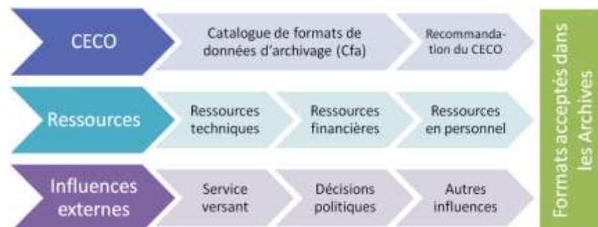
Influences sur le choix du format

La pratique quotidienne montre de plus en plus que le choix du format d'archivage approprié ne dépend pas seulement de la catégorie de format correspondante. Il est influencé par divers facteurs et dépend également de la décision d'évaluation.